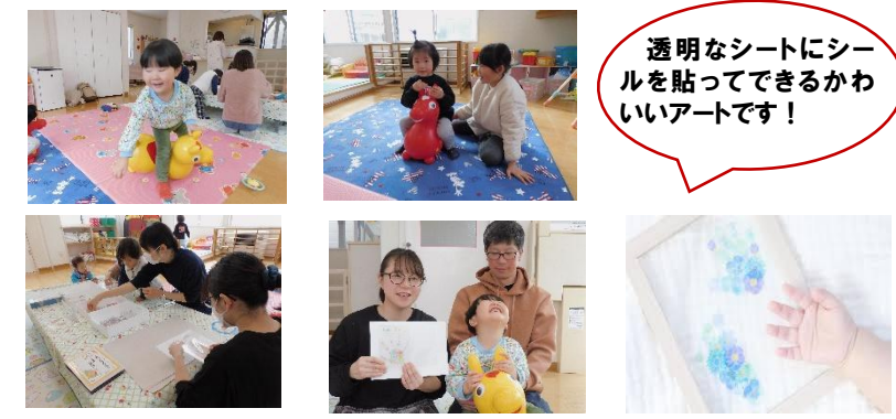
※写真は、皆様からの同意に基づき掲載しております。